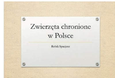
Rys 1. Slajd tytułowy

7) Pracę zapisz jako prezentację programu PowerPoint w folderze pod nazwą kozica .