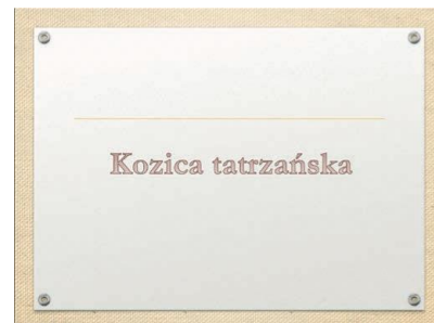
Rys 1. Slajd 2